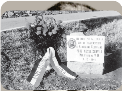
ფორე მოსულიშვილის საფლავი